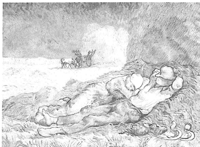
Les quatre saisons : L'été de Van Gogh.