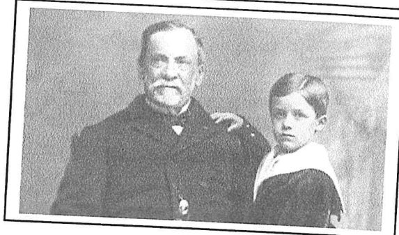
Louis Pasteur et Joseph Meister

Une fois le garçon guéri, Pasteur publie un article sur le cas. L'histoire fait le tour du monde et les dons affluent. Un institut centré sur le vaccin est alors créé : l'Institut Pasteur.