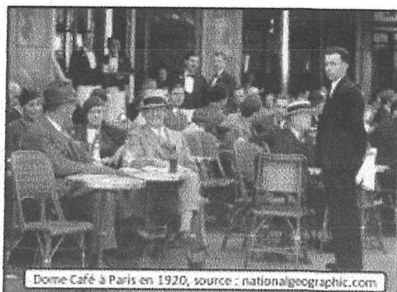
Dôme Café à Paris en 1920

Nous sommes en 1919. Vous êtes assis à la terrasse d'un café autour d'un verre avec un de vos amis. Vous venez de lire dans les journaux le projet de loi du député Pierre-Etienne Flandin : accorder le droit de vote aux femmes de plus de 21 ans et la possibilité qu'elles soient élues aux conseils municipaux des communes. Comme la grande majorité des hommes à l'époque, vous êtes très machistes et donc scandalisés par ce projet ! Vous en discutez bruyamment quand deux femmes, vous entendant, viennent engager le débat avec vous pour vous contredire. Vous jouez ce débat. Voici quelques arguments :