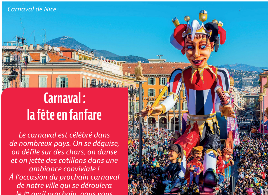
Carnaval de Nice